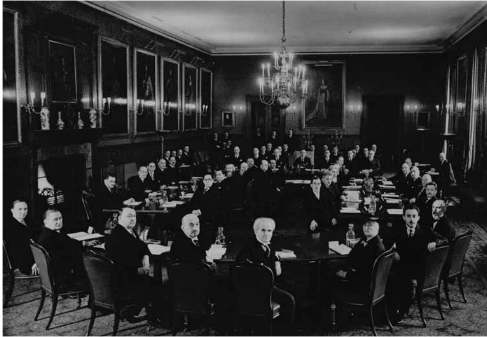
דוד בן-גוריון וחיים ויצמן בוועידת השולחן העגול בארמון סנט-ג'יימס בלונדון, פברואר 1939