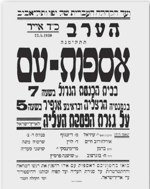
כרוז הקורא לאספות-עם נגד הפסקת העלייה בתל-אביב, 22 במאי 1930

בן-גוריון מצא עצמו בכדידות מזהרת, אך גישתו הייתה לנחלת מאות רבות של חברי מפא"י, שלבטח חלקו את רשמיהם מהמועצה עם עמיתיהם בסניפים ועם ידידיהם בשיחות חולין. יודעי ח"ן מביניהם ידעו לאתר בהחלטות מועצת מפא"י שפורסמו בעיתונות התקופה רמז שברמז לסערה שהתחוללה בפתח דיוני המועצה: בין החובות שעל פי קביעת המועצה היו מוטלות על 'הישוב העברי בארץ ישראל' בשעה זו, נזכרה החובה 'להניס מתוכו כל רפיון וכל פניקה מלאכותית'. 20 למען הסר ספק, בתודעת בני הדור מן הנמנע היה להטיל באדם כבן-גוריון ולו שביב רכב של רפיון ופניקה; אמירה זו כוונה במיוחד אל מתונים כגון אנשי 'ברית שלום' והקרוכים לדעותיהם, אך בנאום בן-גוריון במועצת מפא"י נוצרה קרבה הדוקה בין רגשות גועשים ונסערים לבין תגובת יתר מתלהמת. הענקת לגיטימציה להפצת רגשות עזים אלה בציבור הרחב עלולה הייתה לעורר בחוגים מסוימים פניקה, תוך מתן הכשר מובלע להבערת תבערה שתוכנה הפרקטי נותר סתום, ושאהריתה מתן עידוד ללכטים מרפי ידיים ומייאשים. ישראל אידלסון (ברי-הודה), חבר יגור מ'הקיבוץ המאוחד', ביקש להרחיק עדות לפני שתקף חזיתית וטען במועצה כי 'הכניסו בפיו' של בן-גוריון 'דברים, כאילו צריך מיד להתחיל להרוס את האימפריה הבריטית', ואז חרץ: 'גנרל של צבא מוכה – לפי ביטויו של משה שרתוק – שמכניס דמורליזציה ויאוש ופחד בשורות המחנה, הוא חייב משפט מות, גם משפט מות פוליטי [...] אנחנו צריכים לכל אחד מחברינו לומר, אינך יכול לתת את התשובה [לתת מענה פוליטי שקול], אל תחשוב, שיש לך הרשות לבוא ולהרוס את השורות'. 21