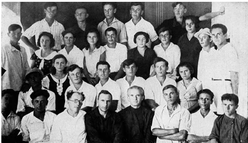
דוד בן-גוריון (במרכז השורה התחתונה) עם קבוצת הנוער ברחובות, גרעינו של קיבוץ נען (1929)

כפולה, שוות משקל, כלפי היהודים והערבים בארץ-ישראל. משמע שרוב יהודי ומדינה יהודית לא עמדו עוד על סדר יומה של בריטניה. בכך למעשה נזנחה ההבחנה שבוטאה בהצהרת בלפור, ושהייתה יסוד למדיניות בריטניה עד אז: העדפת מימוש השאיפות הלאומיות של היהודים. 9 מועצת מפא"י כונסה ב-25-26 באוקטובר כדי לגבש את תגובת המפלגה על התפנית החדה במדיניות הבריטית. היה זה כינוס מפלגתי רחב היקף ראשון בתולדות מפא"י (שהוקמה עשרה חודשים וחצי קודם לכן) שדן בסוגיות מדיניות אופרטיוויות הרות גורל. עיתון ההסתדרות, 'דבר', דיווח כי למועצה, שדיוניה החלו במוצאי שבת והתקיימו באולם ועדת התרבות של ההסתדרות ברחוב נחמני בתל-אביב, נזעקו כל חבריה מקצות הארץ. האולם, שנגדש אלף איש, לא הכיל את המוני החברים, שבאו להקשיב לביטוי השעה, והוכרחו לחזור לביתם. 10 בהתאם להחלטת מזכירות מפא"י טרם תחילת דיוני המועצה, נשא בן-גוריון את נאום הפתיחה. בישיבת המזכירות שקדמה לכינוס המועצה לא טרח בן-גוריון לעדכן את חבריו במסר הבוטה שבכוונתו להשמיע בפני באיה. 11 עיקר נאומו יוחד כצפוי לתקיפת תוכנו של ה'ספר הלבן', שבו ראה מעשה צביעות ובגידה מצד ממשלת בריטניה בציונות. אמירה מעין זו הייתה שגורה למדי בלקסיקון הניגוח הציוני, שנהוג היה לגייסו בנסיבות חמורות מעין אלה להשמעת קריאות תוכחה רמות ונרגזות כלפי הבריטים. ברם קביעתו של בן-גוריון כי מאחורי 'הקרדום' שהונף עומד 'רצון לעקור מן השורש את היהודים מארץ ישראל', הייתה בבחינת