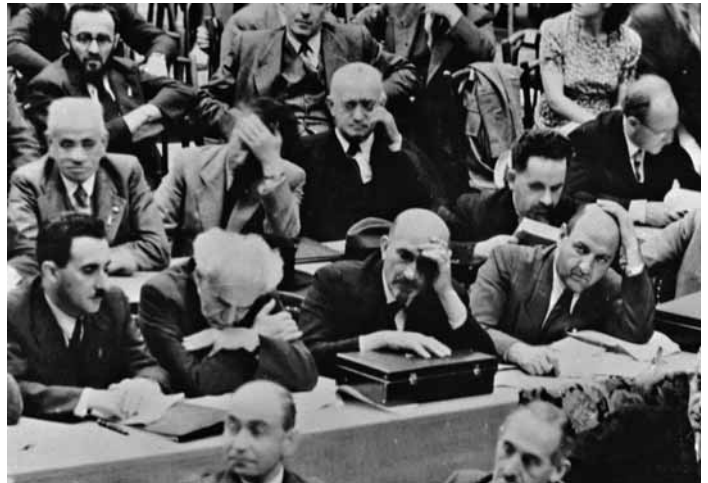
מנהיגי היישוב בקונגרס הציוני בז'נבה, אוגוסט 1939, ערב פרוץ מלחמת העולם השנייה; מימין לשמאל: אליעזר קפלן, חיים ויצמן, דוד בן-גוריון ומשה שרתוק

אלא במסגרת של דור חלוצים, מגשימים, שפעלו יחד עמו בהגשמת חזון הציונות ובכניית הארץ'. 93 אם להמיר את הביטוי 'דור חלוצים, מגשימים' למסגרות פוליטיות ראליות וקונקרטיות, הרי המדובר בראש ובראשונה במפא"י – לאו דווקא במנגנון המפלגה ובמופקדים על תפעולו השוטף תוך ניהול מאבקי כוח וקידום אינטרסים פרטיקולריים שינקו מצורכי היום-יום, אלא בצמרת הרחבה של אישי המפלגה, בהשקפת עולמם ובעמדותיהם הפוליטיות הקשובות לאילוצי השעה ולמציאות המשתנה, כפי