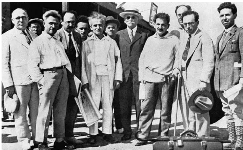
קבלת פנים לאברהם (אייב) כהאן, ממנהיגי תנועת הפועלים היהודית בארצות-הברית (במרכז התמונה, לבוש בחליפה) בתל-אביב (1929). מימינו ברל כצנלסון ומשמאלו דוד בן-גוריון

בן-גוריון מילא תפקיד נכבד בהתגוששות על קידומן של חלופות אידאולוגיות ופוליטיות בכמה צמתים היסטוריים משמעותיים מאוד בשנות השלושים. אחד ההיבטים שראוי לתת עליהם את הדעת בהקשר זה הוא שרטוט המרחב שהותירה מפא"י לבן-גוריון, ושהוא יצר לעצמו, כדי להשמיע השקפות בלתי שגרתיות ולפעול פעם אחר פעם בדרכים חריגות ובאופנים שפרצו את תחומיה המסדיים השגורים. על בסיסם של אלה ומכוחם התאפשרה להערכתי עליותו מדרג מנהיגותי היונק את השפעתו המפלגתית מבקיאותו המופלגת במלאכת הארגון של מסגרות פנימיות שהתמקדו בחיים החברתיים והכלכליים, וכן מכישורו להתוות תכניות פוליטיות שהצטיירו כפתרונות יעילים לבעיות שהתעוררו במציאות המשתנה, למעלת מנהיג הזוכה להערכה, הוקרה ואמון מתוקף מעלותיו וכושרו להיאבק בהצלחה לקידום יעדיו.