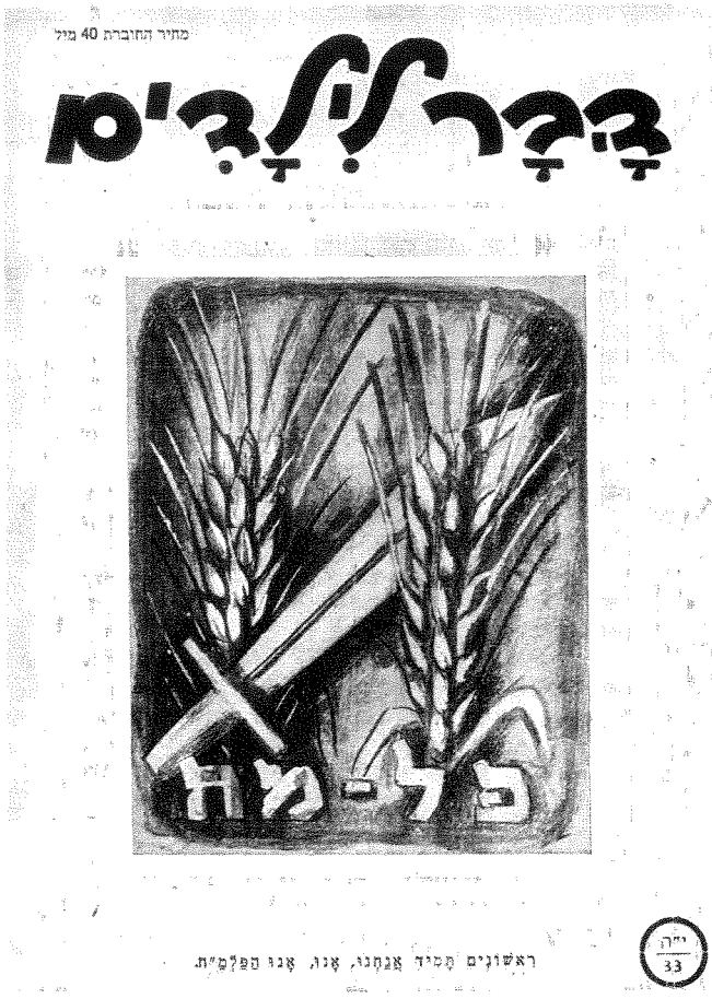
ראשונים תמיד אצטנני, אנו, אנו הפלמ"ח.

האימרה האחרונה הינה גילוי, מתון אמנם, ליוהרה צבאית שבדרך כלל נעדרה מעתוני הילדים. בכתיבה שהצנית לקה לא אחת הצופה לילדים. בעקבות הדיפת ההתקפה על קיבוץ טירת צבי בעמק בית שאן בפברואר 1948, שיעשע עורך העתון את קוראיו בספרו כיצד ילדי המקום פרצו בצחוק כשהמפקד סיפר להם שמצאו בביצות חמישים זוגות נעליים של ערבים, שחלצו אותם וברחו יחפים משדה המערכה, ושבחגורתו של כל פורע היה טמון שקיק מלא סוכריות ושקדים. 23 כעבור שבוע התגאה העתון כי "אגדת הישראלים הגיבורים מתהלכת בין ערביי ארץ ישראל. הם אומרים שאלוהים לוחם למען היהודים המאמינים בו. שלוש פעמים התקיפו הערבים יישובים דתיים (כפר עציון, כפר יעבץ וטירת צבי) ובכל המקרים נחלו תבוסה קשה". 24 למותר להעיר כי כאשר נכנע כפר עציון חודש וחצי מאוחר יותר לא חזרו בהצופה לילדים על הקביעה "שאלוהים לוחם למען היהודים המאמינים בו". כתיבה שנמוג בה טון מתלהם היתה גם מנת חלקו של מדור ה"סיפורים מהחזית" של הבוקר לילדים. תוך שימוש בביטוי רווח בקרב בני הארץ באותה תקופה, תוארה מיומנותו של עוזי הצלף, שחיסל ערבי בעמדה ממול ומלמל לעצמו: "שידעו כבר פעם מה זאת עבודה עברית...". 25