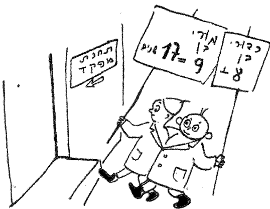
אפילו מדורי ההומור גויסו להרמת המוראל. "אורי מורי", המדור הפופולרי בדבר לילדים נכתב וצויר על ידי לאה גולדברג ואריה נבון

2) אפר לו אורי לקבר: בוא, את קנטינו קפירו! והנה קך יקרה טנס אורי מורי יתגיס.