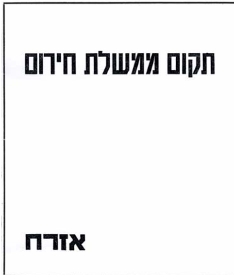
השם והכתובת שמורים במערכת הארץ, 26.5.1967, עמוד ראשון

מאמר המערכת ב-25 במאי סימן תפנית בגישתו של הארץ כלפי עניין פוליטי מסעיר העומד על סדר היום, הרי כעבור יום התברר שהתביעה להחלפת צמרת קבלת ההחלטות במדינת ישראל זוכה לעוד ועוד ביטויים בהארץ.