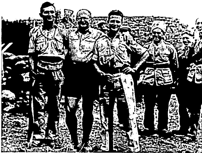
יצחק שדה (במרכז) יגאל אלון (מימין) ומשה דיין (משמאל), בחגיגתה 1938