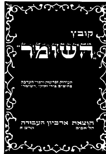
כריכת קובץ השומר, תרצ"ח

העבודה'. חברי 'השומר' נאלצו לשלם מעין 'מס' לאכסניה ההסתדרותית שבזכותה יצא ספרם לאור, ובספר שולבו מאמריהם של ש"ד יפה (ממפלגת 'הפועל הצעיר') ושל בן-גוריון (ממפלגת 'פועלי ציון' ובהמשך 'אחדות העבודה'), שלא נכללו מדרך הטבע במתכונת המקורית של הספר. 41 בהוצאת הקובץ ביטאו חברי 'השומר' את הכרתם-השלמתם עם העובדה שהגיעה השעה לצרור את קורות ארגון 'השומר' בין דפי ההיסטוריה היישובית. משמעותה של ההחלטה הייתה מעין הודאה סמויה בכך שדרכם הציבורית הגיעה לקיצה וכעת זמנה של ההנצחה והנחלת התורה לדרות הבאים. שני דגשים מרכזיים ניכרו