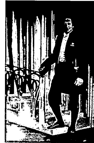
יצחק בן צבי

צבי (שכנראה אף הוא חשד בכוונותיה של מניה אך בזכות קשרי העבר מימי 'השומר' נמנע מלהתייצב בגלוי נגדה), וכן ישראל שוחט שהשתתף בישיבה, צידדו בשליחות. בלית ברירה, הודיעה מניה שוחט כי תיכנע לדין ההסתדרות והבטיחה להימנע מפעולות בלתי מוסכמות. לבסוף סוכם לאשר את נסיעתה אך לרחות את ההחלטה על מועד יציאתה בכמה שבועות. 25