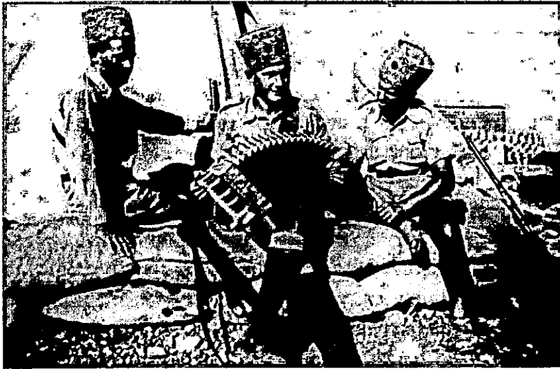
נוטרים בגדר הצפון, 1938

מכשולים טבעיים. החיץ נועד להבדיל מטעמים ביטחוניים בין הערכים שיימצאו משני צדי הגבול ולהקטין את ההשפעה ההרדית ביניהם. 74 אך הקמתו חתרה בה במידה גם תחת האפשרות לטפח יחסי שכנות לאורך הגבולות בין יהודים לערבים. גישת ראשי ה'הגנה' בנרון חפפה לקו המחשבה הצבאי הכריטי שיושם באותה עת בגבול הצפון.