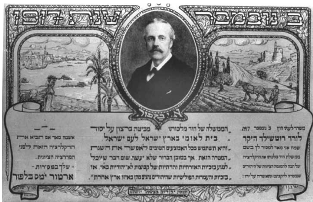
גלויה שעוצבה ב'בצלאל' בעקבות הצהרת בלפור, נובמבר 1917