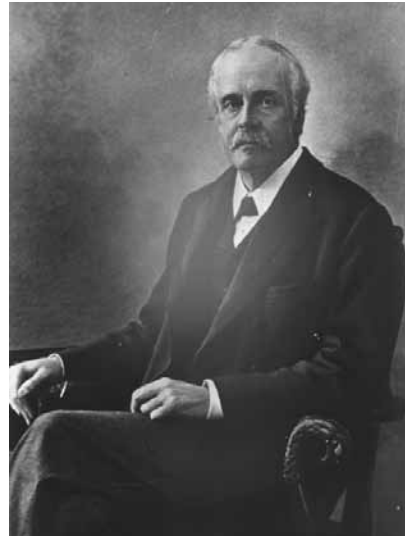
ארטור ג'יימס בלפור, 1.11.1917

כולו אחוז אש. מיליוני יהודים מתבוססים ברעב ובמגפות, נדרסים ונרצחים בראש חוצות. אולם יום זיכרון הוא לנו יום זה. ציון רב ערך להיאבקתנו על גאולתנו הלאומית'. בן-גוריון פירט את המשמעויות העיקריות של הצהרת בלפור וסיכם כי עתה ניתן לפעול ביתר ביטחון מאשר לפני 25 שנה, 'בקומה זקופה כאומה הדורשת מלוא זכויותיה'. מנגד הדגיש הרצוג אלמנט אחר: 'אנו מסתייעים בהצהרת בלפור, אך לא בה נתחיל. ראשיתנו נעוצה בהבטחה שניתנה לפני יותר מ-60 יובלות על ידי ה' לאברהם אבינו. העולם יקום מחדש על יסודות תרבות, על יסודות חסד אמת ושלוש שהונחו לפני שלושת אלפים שנה. האומות לא תוכלנה להתעלם מזכותנו על