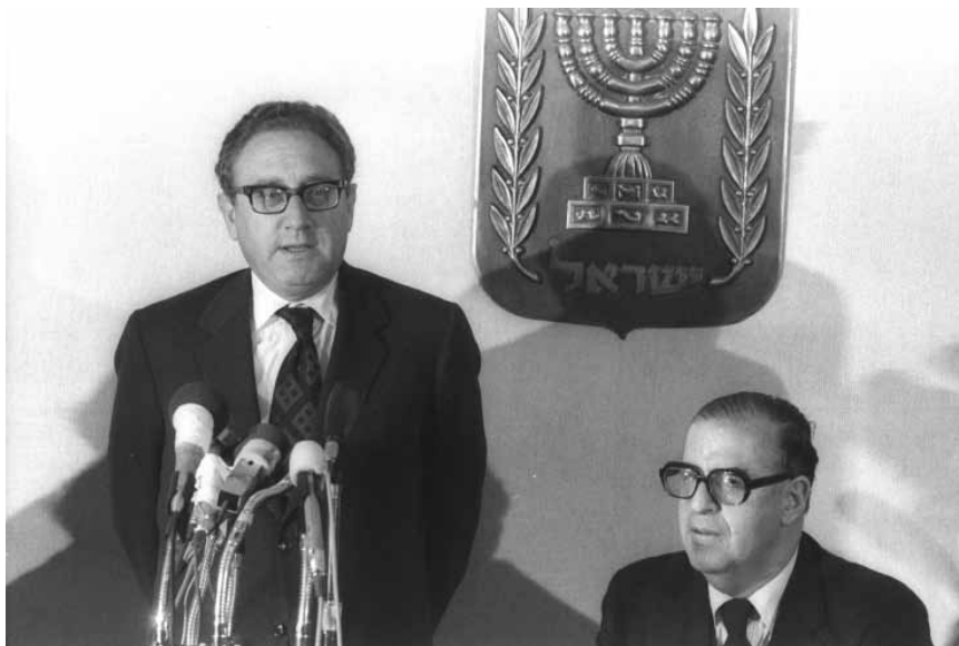
הנרי קיסינג'ר ואבא אבן, 17.12.1973

באופן גורף במועמדי המפלגה הדמוקרטית, הרי שבעקבות מדיניותו הפרו-ישראלית זכה הנשיא בבחירות 1972 כמעט לארבעים אחוז מקרב קולות יהודי ארצות הברית. 105 רביעית, עלייה בהשפעתו של קיסינג'ר על ניקסון. בהתקרב שנת הבחירות בארצות הברית, מסעו של ניקסון לסין וועידת הפסגה במוסקבה שנועדו להתקיים בשנת 1972, הגיעה השפעתו של קיסינג'ר על הנשיא האמריקני לשיאה. למעשה ניקסון היה תלוי בו באופן מוחלט לא רק בקידום מדיניות החוץ אלא אף במדיניות הפנים, בהיותו של קיסינג'ר הנכס האלקטורלי הנכבד ביותר. על כן נראה כי הנשיא החליט לאמץ באופן מלא את המלצותיו גם בכל הנוגע לזירה המזרח תיכונית. לאור זאת ניקסון נמנע מעימות עם קיסינג'ר בעניין המדיניות האמריקנית במזרח התיכון, מה גם שמלכתחילה הטיל הנשיא ספק בסיכויים לקדם את ההסדר החלקי בתעלה.