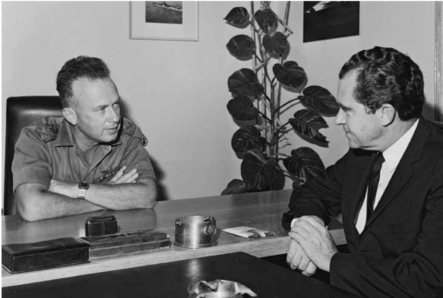
סגן נשיא ארצות הברית לשעבר, ריצ'רד ניקסון, בפגישה עם הרמטכ"ל יצחק רבין, 22.7.1967

הסכסוך, או לפחות מניעת הסלמתו, כך נטען במחלקת המדינה, יסייעו בשיקום מעמדה של ארצות הברית בקרב מדינות ערב ובייחוד במצרים וברדן. על כן האמינו במחלקת המדינה כי יש צורך לאמץ 'מדיניות שקולה ומאוזנת' ביחסה של ארצות הברית אל הצדדים הנצים, קרי ישראל ומצרים, כדי להתניע תהליך מדיני. במסגרת מדיניות זו גרסה מחלקת המדינה כי תמורת הסדר שלום, ישראל תצטרך לוותר על רוב השטחים הערבים שנכבשו ב־1967. זאת ועוד, היו אף גורמים במחלקת המדינה האמריקנית שהרחיקו לכת והתנו את הספקתו של הסיוע הצבאי לישראל בנכונותה של זו לגלות 'גמישות מדינית', קרי ויתורים טריטוריאליים למדינות ערב ובייחוד למצרים. 5