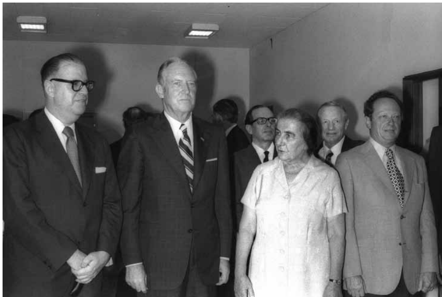
פגישת אבא אבן, ויליאם רוג'רס, גולדה מאיר ויגאל אלון במשרד ראש הממשלה בירושלים, 6.5.1971

בפגישה זו. מתוכנו של סיכום זה אפשר להתרשם מה היו מטרותיה של ישראל בדיוניה עם מזכיר המדינה. וכך נכתב: