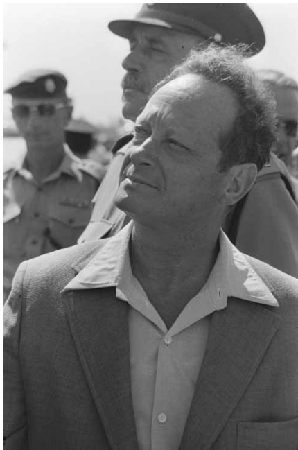
סגן ראש הממשלה ושר החינוך יגאל אלון, 23.5.1971

הסובייטים לקראת כינוסה של ועידת הפסגה במוסקבה שנועדה להיערך בשנת 1972. היועץ לביטחון לאומי, שהיה מופקד על השיחות בין וושינגטון למוסקבה וייחס חשיבות עליונה לערוץ זה, שבו דנו בין השאר בצמצום כמות הנשק הגרעיני של שתי מעצמות העל, חשש כי קידומו של הסדר הביניים בתעלת סואץ, ללא שיתופה של ברית המועצות, יעכיר את האווירה בדיונים בין שתי מעצמות העל ויקרין באופן שלילי על דיוני ועידת הפסגה. ואכן, ה'דטאנט' (De'tente) עם ברית המועצות תפס חלק עיקרי יותר ויותר במדיניות החוץ של קיסינג'ר. מימשל ניקסון, בניגוד לקודמו, יצר הייררכיה בתפיסת האיומים על ארצות הברית. אזורים פריפריאליים, ובהם המזרח התיכון, קיבלו חשיבות מועטה יחסית מול פוטנציאל הסיכון של האימפריה הסובייטית. האינטרס העליון של ארצות הברית, לדידם של קיסינג'ר וניקסון, היה אם כן לנסות 'למתן' את המדינה שהייתה מסוגלת יותר מכולם לאיים על מאזן הכוחות העולמי ועל האינטרסים האמריקניים בזירות השונות – ברית המועצות.