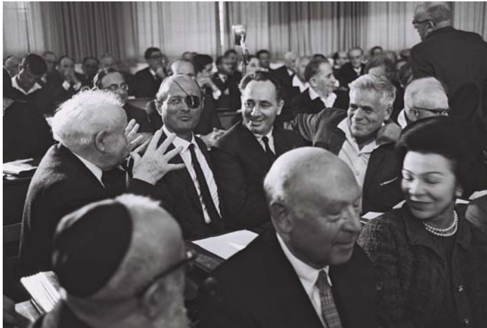
בן-גוריון, משה דיין, שמעון פרס ויעקב חזן במושב הפתיחה של הכנסת השישית בירושלים, 22.11.1965