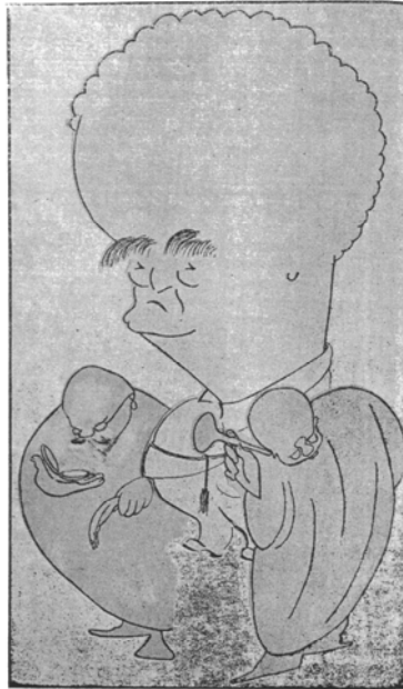
הרופאים בודקים את בורגוריון. הרופאים: אכן, עברה הסכנה, לא נשאר בו פגמחלת הסוציאליזם ולא כלום.