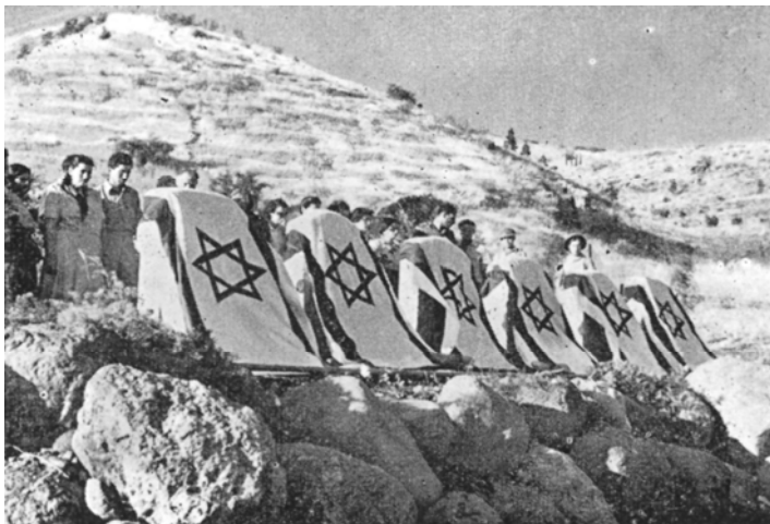
בית הקברות בקיבוץ עין גב במלחמת העצמאות [עין גב במערכה]

גורליות את החברותה. אם זה קרה רק לאחר – הרי כולנו נתונים בתוך מעגל הסכנה והמוות והנופל הוא בעצם חלקו האחר של מי ששרד. 44 כולנו חבורה אחת של אלה שהתנדבו לעמוד בסכנות המוכחות בעליל על ידי מותם של מקצתנו.