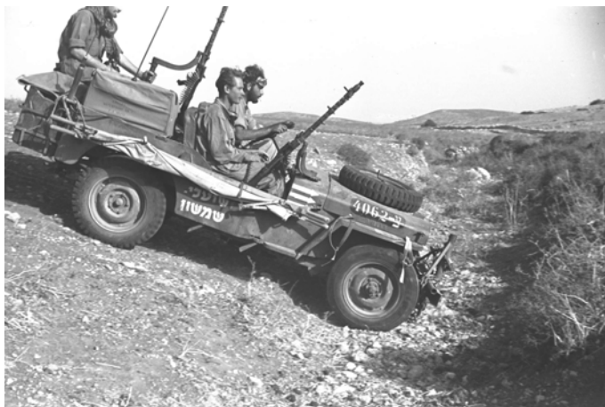
לוחמי 'שועלי שמשון' באל-עג'ור, 19.10.1948