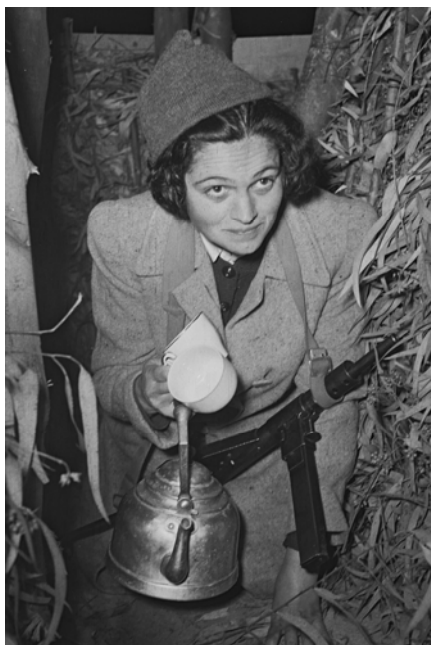
חברת 'הגנה' מביאה תה ללוחמים במושב כפר מונאש, 12.2.1948

ירושלים וטיהורה'. 64 הדברים נכתבו לאחר שכוחות הפלמ"ח נסוגו וימים ספורים לפני נפילת הרובע היהודי, שאנשי הפלמ"ח לא הצליחו חרף 'גבורתם' להצילו. דווקא העיתונים שהשכילו לגייס 'כתבים' מתוך שורות הלוחמים, זכו גם להדפיס תיאורי קרב אוטנטיים יותר. סביר להניח שהפער בין מה שבאמת קרה בשדה הקרב לבין הדרך שבה דווחו הדברים מעל דפי העיתונים, נתפס על-ידי הלוחמים כביטוי נוסף למחיצה שחצצה בינם לבין אנשי העורף. אחרי הכל, העיתונאים שהופיעו מדי פעם בחזית לשעות ספורות, אך על-פי-רוב חזרו בסופו של יום אל העיר הגדולה, היו חלק מן העורף.