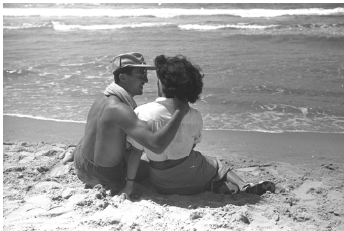
חייל וחברתו בחוף הים, 1.8.1948

עם זאת, ללוחמי תש"ח לא היתה זו רק פוזה שירית וחיקויי חווייה זרה לחוויות היסוד של זהותם כלוחמים, כי אם ביטוי אוטנטי לדרך בה ראו את עצמם, לעומת אלה שנותרו מאחור. למרות נוכחותן הנרחבת של נשים ביחידות הלוחמות, הייתה 'חבורת הלוחמים' בתש"ח גברית בעיקרה. בתודעת הלוחמים נשארו הנשים 'שם, בעורף'. יתר על כן, לעורף, לגעגוע אל העיר הגדולה, התלווה תמיד ממד ארוטי מובהק.