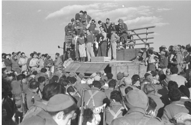
הופעת להקת הצ'יזבטרון בימי מבצע 'חורב' בנגב, 10.12.1948

ערב'. 83 הצגה זו גרמה להתנגשות קשה בין לוחמי החזית ובין התאטרון. חיילי 'גבעתי' נעלבו משום שבמחזה עולה כאילו הם רצו לוותר על הגנת הקיבוץ ואילו אנשי הקיבוץ התעקשו וסרבו לסגת. כל אחד יכול היה להבין שהמחזה עוסק בקרבות סביב קיבוץ נגבה, שעמידתו התאפשרה בראש וראשונה בגלל מעורבותה העמוקה של חטיבת 'גבעתי' בהגנה על הקיבוץ וסביבתו בכל שלבי הלחימה. הפגנות של לוחמים גרמו להתערבותו הנזעמת של דוד בן-גוריון, שניסה לשווא להניע את השחקנים המהוללים, חנה רובינא ואהרון מסקין, לשנות מקצת מהטקסט. חרף הסערה המשיך המחזה לרגש קהלים רבים שלא ראו בו פגיעה בגבורת הלוחמים, המתיישבים והחיילים כאחד. הסערה העידה על מידת ההתרגשות שחוללו הניסיונות הללו להציג בפני הקהל בעורף את חווית המלחמה בחזית. 84