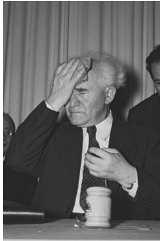
בן-גוריון מוחה זיעה לפני ההכרזה על הקמת המדינה, 14.5.1948

האזרחית וטשטוש ההבחנה בין העורף לחזית המחישו את תחושת הסכנה. בכך, הם הפכו לאמצעי מגייס ומגבש במלחמה שהוצגה כמאבק צודק ומוסרי, אשר יוכרע על-ידי הצד שישכיל לגייס את כוחותיו במידה המקסימלית. 31 מכאן המסרים החוזרים ונשנים בנאומיו של בן-גוריון: 'החזית אינה "שם" ואף איננה "פה" – אלא בתוך תוכו של כל אחד מאתנו; שלא משק זה או נקודה זו עומדים בחזית, אלא כל איש ואשה, כל נער וזקן, ילד ותינוק, ואנו נתבעים למאמץ עליון הכולל כל אחד מאתנו, ומכל אחד נתבע המקסימום'. 32