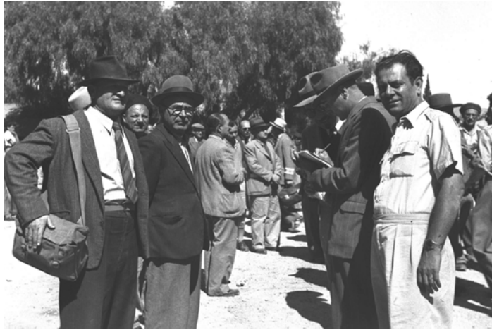
גיוס כוח-אדם בירושלים, 15.10.1948

באפריל 1948 הסתמן אם כן פער בין מטרות תהליך ההתגייסות לבין נתוני הגיוס. למרות המסרים החוזרים והנשנים, וכן קריאות הנהגת היישוב כי המלחמה הגוברת מחייבת את התגייסות היישוב, תקני הגיוס הרצויים לא מולאו ואלפי אנשים כלל לא התייצבו. בישיבת הוועד הפועל הציוני שנערכה ב-6 באפריל, הביע בן-גוריון ספק אם היישוב והעם היהודי נכונים לסגל את אורח חייהם למאמץ העליון שמצריכה המלחמה, ואם אכן הוטמעה בציבור ההכרה שהכרח להשקיע את מרב המשאבים החומריים והרוחניים לטובת המאמץ המלחמתי. להדגשת חומרת המצב, הוא שב ותיאר את העורף כחזית: