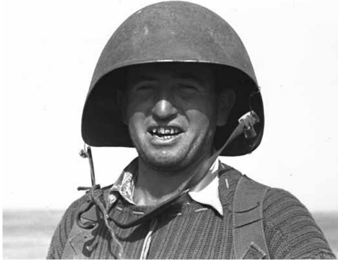
חייל צה"ל שעלה ממרוקו ונלחם בנגב, 20.10.1948