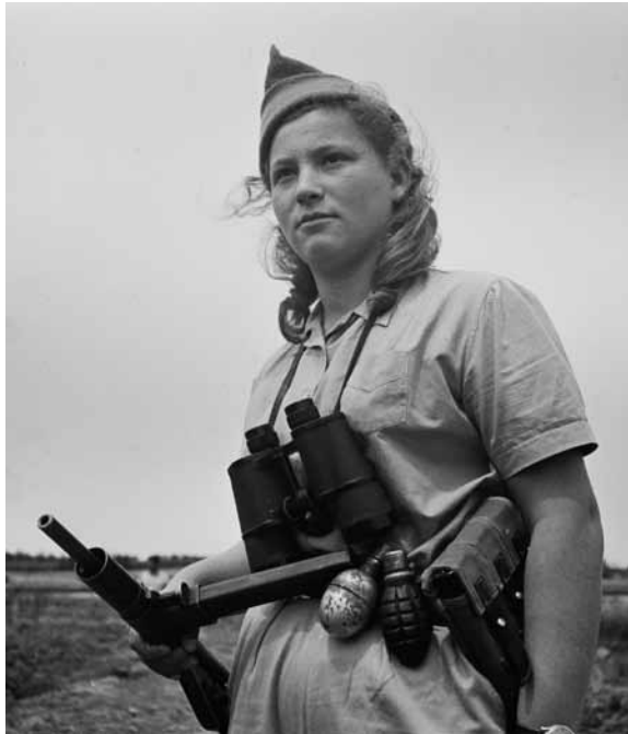
צעירה מ'עליית הנוער' שומרת בבית הספר 'עיינות', סמוך לרחובות, 4.4.1948