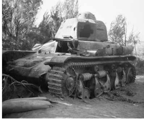
למעלה: הטנק הסורי שניסה לחדור לקיבוץ דגניה, 7.7.1948; משמאל: מגדל המים של קיבוץ בארות יצחק שנהרס בקרבות, 8.8.1948.

אילן מסכם וכותב: 'נתוני הפתיחה המשופרים של ישראל, איפשרו לה ליצור פערי עוצמה צבאית לטובתה, היא לא היססה לממשו בשדה הקרב'. 12