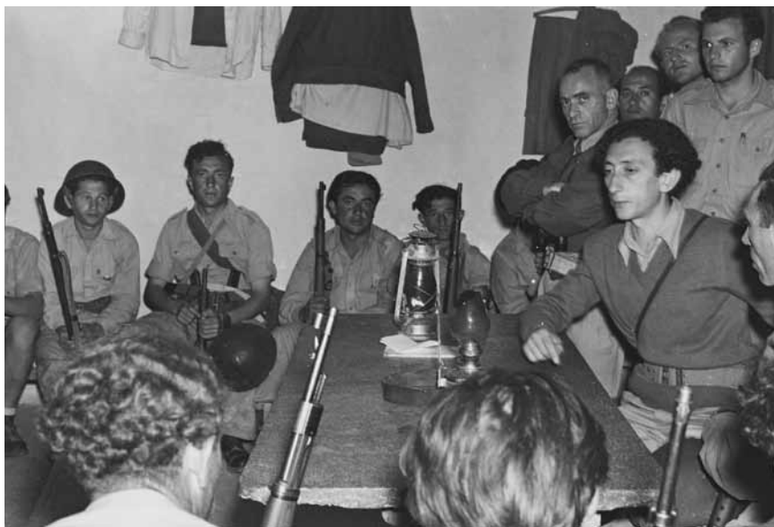
אבא קובנר מתדרך לוחמים בקיבוץ יד מרדכי, 17.5.1948

רבות. 94 רק כוח משוריין וסיוע ארטילרי כבד היו מסוגלים להחליש את תנופת ההתקפה המצרית, אך אלה לא היו בידי החטיבה באותם ימים. 95 גם המצרים הבחינו בחולשה המוכנית של הכוח היהודי. אחד הלקחים שהפיק קצין תותחנים מצרי שהשתתף בקרב הוא ש'האויב [צה"ל] מנצל יפה את החושך להתחלת ההתקפות, אבל באור אינו יכול לעמוד מול האש העומדת לרשותנו'. 96