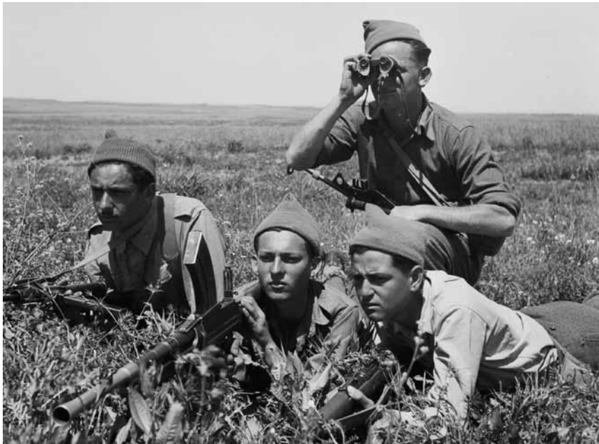
לוחמי ה'הגנה' מתאמנים בעמק יזרעאל, 3.1.1948

היישובים הכפריים ואת קווי החזית בערים המעורבות. בניית הביצורים פיגרה אחרי צרכי המציאות, והביצורים שנותרו מימי המרד הערבי התגלו לעתים כמלכודת מוות בתנאי המערכה החדשים. יכולת ההתבצרות באה לידי ביטוי חשוב בהגנה מפני ההתקפות שהערבים ניסו לערוך על יישובים מבודדים בתחילת המלחמה, כגון ההתקפה על אפעל, על כפר יעבץ, על כפר אוריה ועל שכונת התקווה בדצמבר 1947, וכן על גוש עציון, על כפר סאלד, על יחיעם ועל טירת צבי בינואר 1948. 40 ראוי להזכיר בנקודה זו את כושרה של התעשייה היהודית לשריין לצורכי הגנה כמות ניכרת של משאיות ואוטובוסים. אף שאמצעי זה לא עמד בהתקפות הגדולות של סוף חודש מארס, הוא עזר מאוד נגד צליפות והתקפות ספורדיות ומצומצמות בקיום התחבורה השגרתית דרך ריכוזי הערבים.