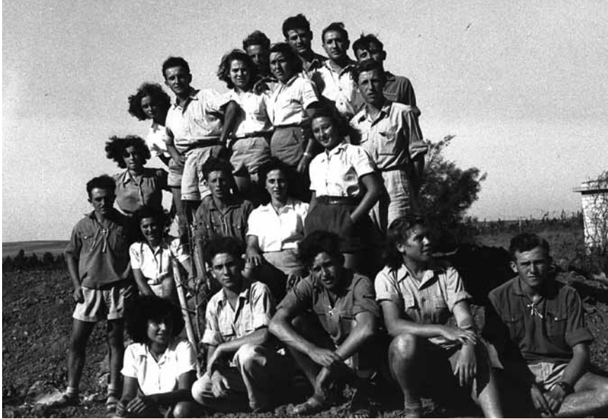
חברי קיבוץ נגבה לאחר הדיפת הצבא המצרי בימי מבצע 'ואב', אוקטובר 1948

יש התולים את לידתו של המיתוס בדרך שבה סיפר בן-גוריון, חזר וסיפר, את סיפורו על מהלכי המלחמה. פעמים אין ספור טען בן-גוריון ש'ההיסטוריה העולמית אינה יודעת דוגמאות רבות של מלחמת מעטים נגד רבים כשל ישראל הצעירה'. 145 אפשר להניח שהדימוי הזה שימש את בן-גוריון להעצמת מעמדו של המצביא שתכונתו עמדה לו להתגבר על כל הקשיים הכרוכים בעמידת מעטים מול רבים. אפשר גם להניח שבן-גוריון היה סבור שדימוי זה תורם לנחישות הלחימה של הגייסות שאליהם נשא דברים כאלה תוך כדי הלחימה. דימוי המעטים סייע לדור כולו, ובמיוחד למפקדים, להעצים את דימוי גבורת הלוחמים ותבונת המפקדים, ולהצדיק את גודל הקורבן שהקריבו משפחות כה רבות. ספרי החטיבות וספרי הזיכרון שראו ברובם אור בשנות החמישים, ונכתבו בידי לוחמים ומפקדים, מתארים ברוח זו הן ניצחונות והן מפלות, וקשה לא להתרשם שתיאורים אלה משקפים בכנות את חווייתם של המשתתפים במלחמה.